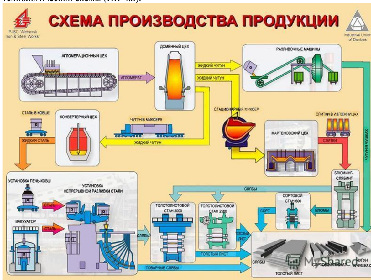
Рисунок – Технологическая схема производства чугуна