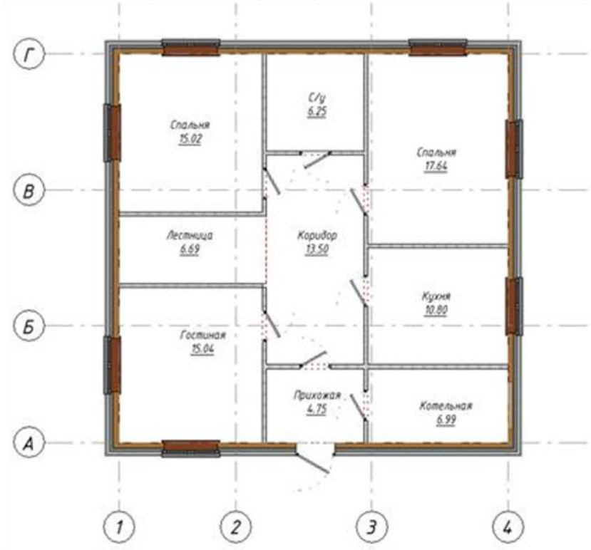
Рисунок 1 – План 1-го этажа малоэтажного жилого здания

С целью осуществления документального сопровождения работ и мероприятий контроля законченных видов и этапов строительных работ решить поставленные задачи (рисунок 1):